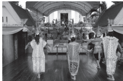
ภาพที่ 3 งานบวงสรวงพันท้ายนรสิงห์

ข้อมูลทางคติชนอีกประเภทหนึ่งที่มีส่วนทำให้ประวัติศาสตร์ หรือเรื่องเล่าต่าง ๆ เกี่ยวกับพันท้ายนรสิงห์เด่นชัดเป็นรูปธรรมมากยิ่งขึ้น นั่นคือ พิธีกรรมบวงสรวงพันท้ายนรสิงห์ ซึ่งภาครัฐเป็นผู้จัดขึ้นที่บริเวณศาลพันท้ายนรสิงห์ ตำบลโคกขาม อำเภอเมือง จังหวัดสมุทรสาคร ในวันขึ้น 9 ค่ำ และ 10 ค่ำ เดือน 3