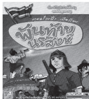
ภาพที่ 1 ตัวอย่างหนังสือการ์ตูนพันท้ายนรสิงห์