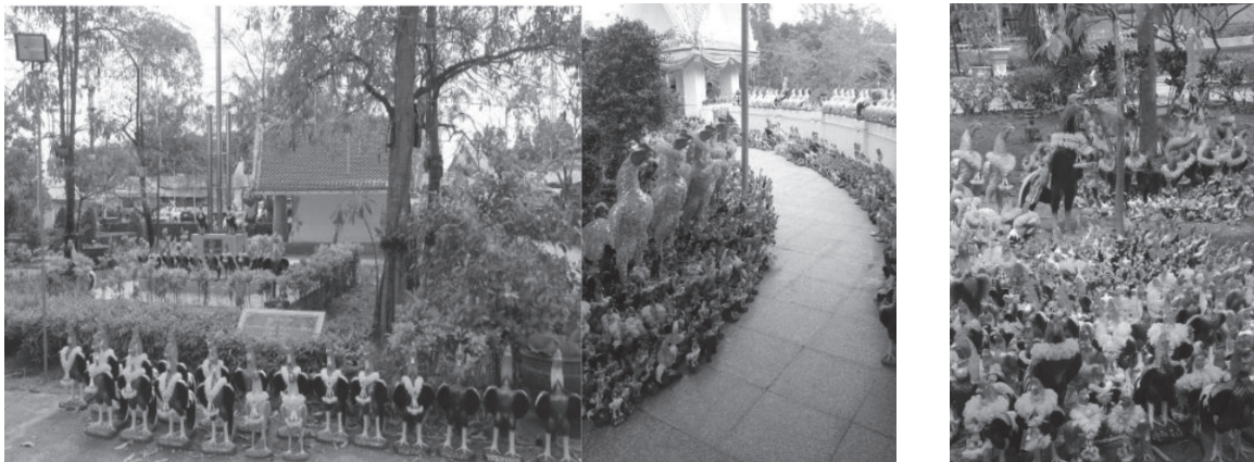
ภาพที่ 2 บริเวณศาลพันท้ายนรสิงห์

นอกจากนี้ พันท้ายนรสิงห์ในปัจจุบัน ไม่เพียงแต่ช่วยเรื่องค้าขายเท่านั้น แต่ยังมีอำนาจช่วยเหลือผู้ที่นับถือในเรื่องต่าง ๆ อีกด้วย ซึ่งจะเห็นได้จากเรื่องเล่าต่าง ๆ มากมายที่เกี่ยวกับความศักดิ์สิทธิ์ของพันท้ายนรสิงห์ เช่น การปรากฏตัวให้เห็นเมื่อมีคนมาลบล้าง หรือ การช่วยเหลือให้แคล้วคลาดจากภัยอันตราย หรือการขอเรื่องยศ ตำแหน่ง เมื่อสิ่งที่ขอลำเร็จตามความปรารถนา ผู้ที่มาบนบานก็จะนำไปถวาย ทั้งนี้มีความเชื่อว่า พันท้ายนรสิงห์ชอบเล่นโกศน ซึ่งในพงศาวดารไม่ปรากฏความเชื่อดังกล่าว ผู้ศึกษาสันนิษฐานว่าน่าจะได้รับอิทธิพลมาจากละครเกี่ยวกับพันท้ายนรสิงห์ ที่ผู้แต่งมักแต่งเติมเนื้อหาให้พระเจ้าเสือ และพันท้ายนรสิงห์ ชอบเล่นกีฬาประเภทเดียวกัน คือ ตีไก่ ชกมวย ตามประสาชายไทยด้วยเหตุนี้ ในบริเวณศาลพันท้ายนรสิงห์ในปัจจุบัน จึงมีรูปปั้นไก่วางเรียงรายอยู่รอบศาลจำนวนมาก