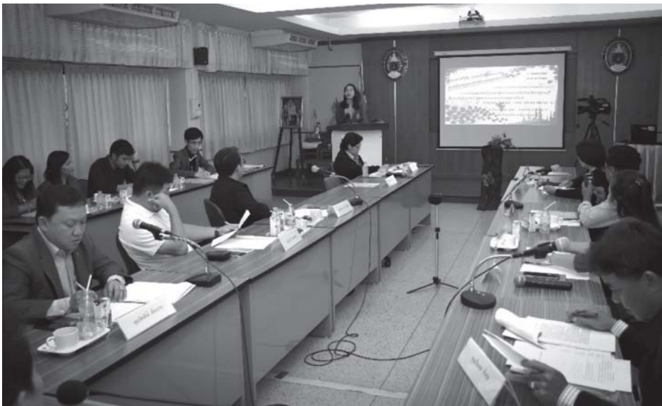
ภาพที่ 2 การจัดสนทนากลุ่ม (Focus Group)

และขอคำปรึกษาเกี่ยวกับข้อมูลแรงงาน ภายในหน่วยงานสามารถให้บริการได้ครบวงจร และดำเนินการภายในพื้นที่เดียว โดยภายในหน่วยงานมีการจัดหน่วยงานทั้งภาครัฐ เอกชน อยู่ในศูนย์ปฏิบัติงานที่จัดตั้งขึ้นอาจประกอบไปด้วยตัวแทนจาก สำนักงานที่ดินจังหวัด สำนักงานตรวจคนเข้าเมือง สำนักงานจัดหางาน อุตสาหกรรมจังหวัด กรมส่งเสริมการลงทุน สำนักงานพัฒนาธุรกิจการค้า บริษัทเอกชนต่าง ๆ ในจังหวัด เป็นต้น