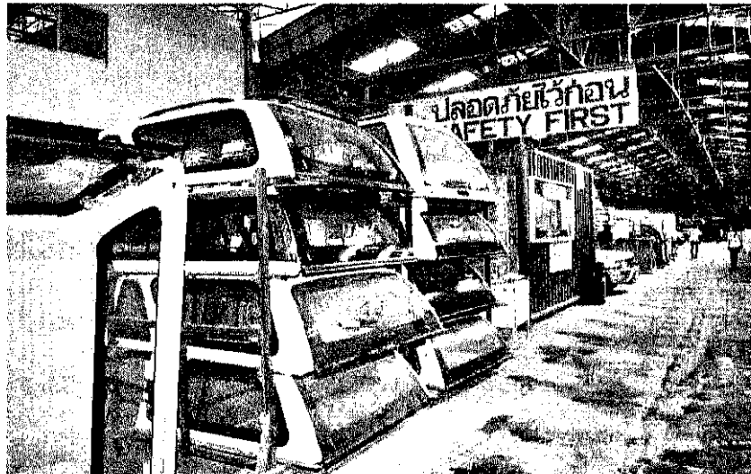
สต็อกหลังคาไฟเบอร์

ส่วนที่เป็นไฮไลต์ แต่ยังไม่สามารถเปิดเผยแบรนด์ได้ คือชุดแต่งสำหรับรถเก๋ง ประเภท สเกิร์ตครอบกัน เปิดตัวทำตลาดได้ในช่วงครึ่งปีหลัง ซึ่งจุดนี้เราคิดว่าด้วยศักยภาพที่มีอยู่ ไม่ว่าจะ เรื่องของบุคลากรในการดีไซน์ ที่มีอยู่กว่า 100 คน การที่มีแหล่งวัตถุดิบ และมีโรงงาน ควบคุม ต้นทุนได้