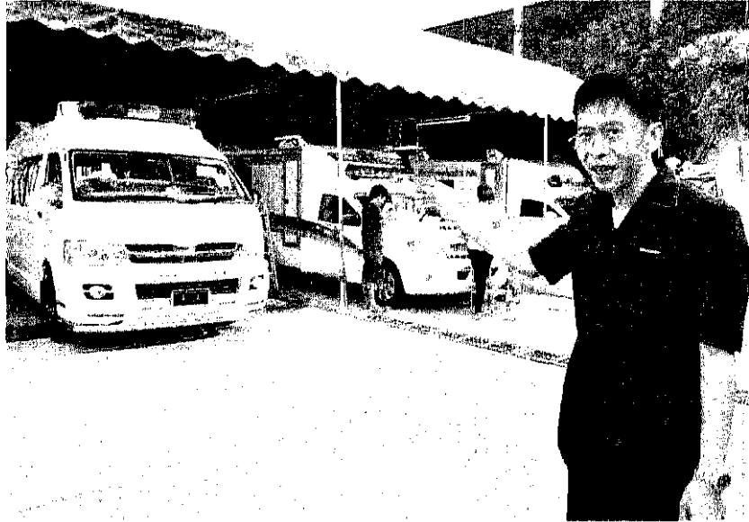
รถพยาบาลเตรียมถวายพระมารดาภคินีรัชกาลที่ 9

สามารถเข้าได้กับรถปิกอัพทุกยี่ห้อ ขณะที่ก่อนเปิดตัวสินค้าทุกรุ่น ทุกชนิด จะต้องผ่านการวิจัย พัฒนา ถัดกันจากทีมวิศวกร ดีไซน์เนอร์ ที่เป็นพนักงานของบริษัทเองกว่า 100 คน ด้วยความละเอียด รอบคอบ ประณีต ทำให้สินค้าดีดตลาดเกือบทุกตัว