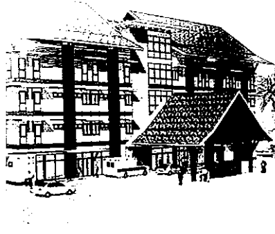
บ้านเรือนไม้ดั้งเดิม 2 ชั้นที่ถนนไชยาเก่า เมืองสาขานคร และ แนวทางการออกแบบอาคารใหม่ที่ ยาวสูงถึง 4-5 ชั้น (ผลงานของสถาปนิก: ณพพงศ์ นพเกตุ โดยปรับเปลี่ยนโครงสร้างบางส่วนได้)