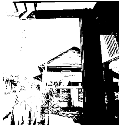
การปรับเปลี่ยนอาคารดั้งเดิมโดยรีอ็อก หากมีการสร้างอาคารใหม่ควรที่จะมีการเว้น "สวนหย่อม" ด้านหน้า และจัดให้มี "รั้วโปร่ง" ที่จะทำให้น้ำบ้านน่ามอง และ ถนนสดชื่น

รู้จักในกลุ่มคนรักผ้าและผู้ซื้อผู้ชายจำนวนหนึ่งแล้ว กล่าวคือหากเมืองสกลนครนี้ได้รับการพัฒนา "ภูมิทัศน์ เมือง" ให้ดี มีการออกแบบสถาปัตยกรรม ภูมิทัศน์และสถานที่ต่างๆ ให้สอดคล้องกลมกลืน มีกลิ่นอายของลักษณะดั้งเดิมของที่ตั้ง ก็จะสามารถทำให้เมืองสกลนครนี้กลายเป็นเมืองที่มีเสน่ห์ภายในตัวเองอย่างมาก ดังนั้น ชาวบ้านชาวเมือง ผู้รู้ นักธุรกิจและผู้นำที่มีวิสัยทัศน์จะต้องเร่งนำเสน่ห์เหล่านี้ขึ้นมาตกแต่งให้โดดเด่นกลายเป็น " Brand สกลนคร " อันจะทำให้กลายเป็นเมืองตัวอย่างที่งดงามของภาคอีสานตอนบนเมืองหนึ่ง ซึ่งจะสร้างความน่าภาคภูมิใจให้เจ้าบ้านมากที่สุดไม่แพ้ใคร