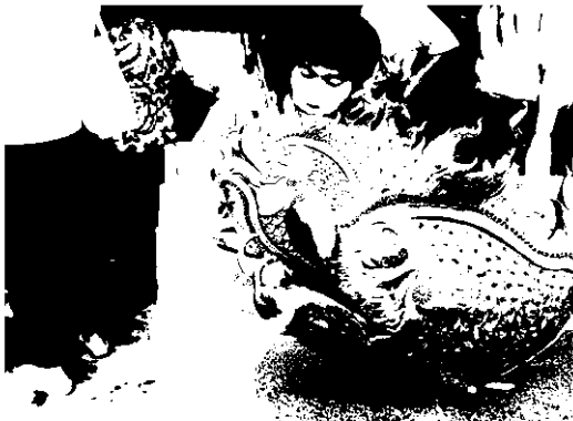
ผลงานปลาในวรรณคดี

“คุณภูมิที่ใช้เผาเป็นตัวแปรสำคัญที่ทำให้ผลงานของเราออกมามีสีเข้มหรือสีอ่อน หากเผาไฟแรงได้สีเข้ม เผาไฟอ่อนก็ได้สีอ่อน ซึ่งเราต้องดูความต้องการของลูกค้าว่าอยากได้โทนสีแบบไหน อย่างไร ทางต่างประเทศนิยมสีเนื้อดินธรรมชาติก็อาจทำให้สีดูเข้มลึกลง แล้วเคลือบผิวให้มันวาวดูน่าใช้ แต่ถ้าของคนไทยนิยมขึ้นรูปเป็นรูปปั้นต่างๆ เช่น องค์พระพิฆเนศ ก็อาจทำให้สีอ่อนเล็กน้อยแล้วนำสีน้ำมันมาทาทับก็จะได้ผลงานที่สวยงามเหมือนทำจากเงินแท้ๆ เขียว” วิทยากรกล่าว