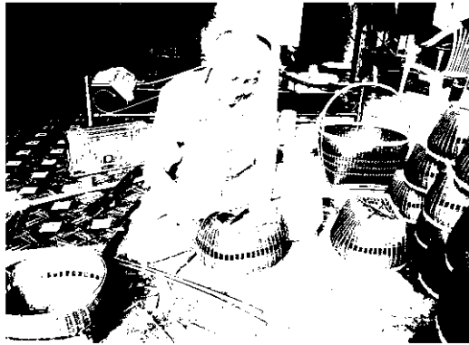
สมาชิกสานตะกร้า

“คุณภูมิที่ใช้เผาเป็นตัวแปรสำคัญที่ทำให้ผลงานของเราออกมามีสีเข้มหรือสีอ่อน หากเผาไฟแรงได้สีเข้ม เผาไฟอ่อนก็ได้สีอ่อน ซึ่งเราต้องดูความต้องการของลูกค้าว่าอยากได้โทนสีแบบไหน อย่างไร ทางต่างประเทศนิยมสีเนื้อดินธรรมชาติก็อาจทำให้สีดูเข้มลึกลง แล้วเคลือบผิวให้มันวาวดูน่าใช้ แต่ถ้าของคนไทยนิยมขึ้นรูปเป็นรูปปั้นต่างๆ เช่น องค์พระพิฆเนศ ก็อาจทำให้สีอ่อนเล็กน้อยแล้วนำสีน้ำมันมาทาทับก็จะได้ผลงานที่สวยงามเหมือนทำจากเงินแท้ๆ เขียว” วิทยากรกล่าว