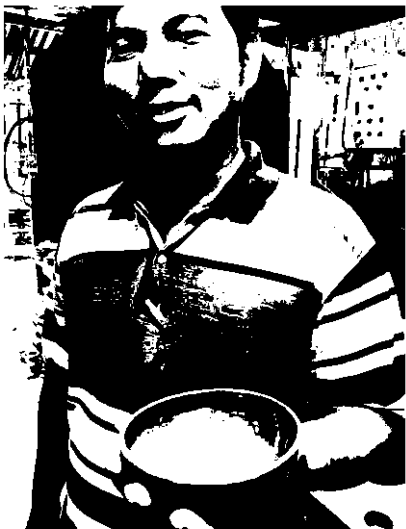
ผลงานเครื่องปั้นดินเผาจากเกาะเกร็ด

ดูหมายต่อไปคือ “เกาะเกร็ด” เป็นเกาะขนาดกะทัดรัดที่มีสายน้ำเจ้าพระยาโอบล้อมตัดขาดจากแผ่นดินใหม่