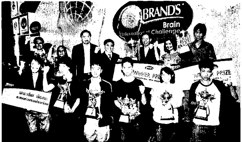
โฉมหน้าเยาวชนคนเก่งคว้าแชมป์มาถึง 8 ประเภท

8 เกมส์พัฒนาสมอง ที่แบรนด์ได้รวบรวมไว้ในการแข่งขัน หรือ “BRAND’S Brain International Challenge” ได้แก่ ครอสเวิร์ดเกมส์ ซูโดกุเกมส์ ไอคิวเวิร์ดอัฟเกมส์ เอเม็ทเกมส์ คำคมเกมส์ โกลด์ฟิงเกอร์เกมส์ ไฟร์สตาร์เกมส์ และ พิคแอนอนด์แพร่เกมส์ ซึ่งล้วนแต่เป็นเกมส์ที่มีส่วนช่วยในการเสริมสร้างปัญญาพัฒนาความสามารถในด้านภาษา การคิดคำนวณ การวางแผน ความคิดสร้างสรรค์และไหวพริบได้ดีทีเดียว ซึ่งได้รับความสนใจ