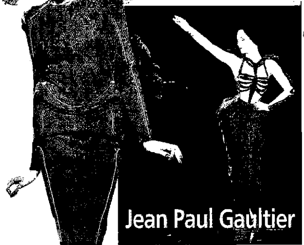
Jean Paul Gaultier

ส่วนดีไซเนอร์ที่สร้างสีสันตลอดทุก ฉอง ปอล โกดตีเยร์ ผู้สร้างตำนานแฟชั่นทรงบรา มีหาง พู่ ให้มาคอนเน่าเป็นที่รู้จักทั่วโลก ครึ่งนี้ได้แรงบันดาลใจจากโครงสร้างกระดูกของพวกเรา มาออกแบบเป็นผลงานแฟชั่น โดยเลือกใช้เส้นร่างมาเป็นลวดลายลูกเล่นบนเนื้อผ้าที่ยกไหล่ตั้งแสดงให้เห็นโครงสร้างที่สวยงาม พร้อมชุดทูลีตาที่ถอดออกได้เป็นอันมีลูกเล่นสมเป็นดีไซเนอร์จอมป่วนของวงการจริงๆ!!