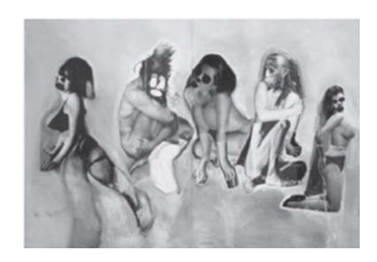
ภาพของโจทก์ ภาพของจำเลย (หมายเหตุ – ภาพโจทก์ปรากฏในภาพจำเลยในตำแหน่งที่สองและสี่จากซ้ายไปขวา)