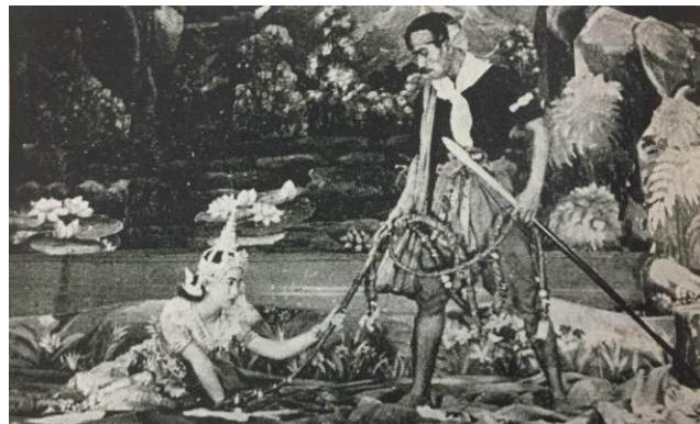
ภาพที่ 4 การแสดงละคร เรื่อง มโนห์รา ตอน พราณบุญจับนางมโนห์รา