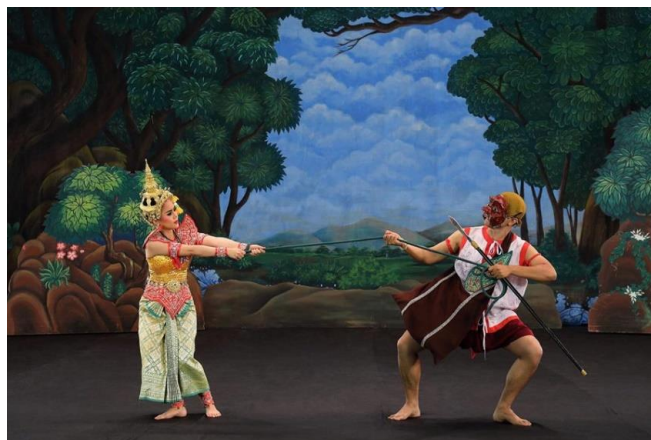
ภาพที่ 3 พราหมณ์จับนางมโนห์รา

จากที่กล่าวมาจะเห็นได้ว่าตัวละครพราหมณ์มีความสำคัญอย่างยิ่งในละคร เรื่อง มโนห์รา ในทางด้านวรรณกรรมพราหมณ์เป็นตัวแปรสำคัญที่ทำให้นางเอกกับพระเอกมาพบกันจนทำให้เกิดเรื่องราวต่าง ๆ ตามมา ดังนั้นในบทความนี้จึงมุ่งนำเสนอตัวละครพราหมณ์ในละคร เรื่อง มโนห์รา ของกรมศิลปากร ทั้งบทบาทและความสำคัญของตัวละครพราหมณ์โดยศึกษาข้อมูลจากเอกสารที่เกี่ยวข้อง สัมภาษณ์ข้อมูล จากศิลปินอาวุโส และการสังเกตแบบมีส่วนร่วม เพื่อเป็นแนวทางในการศึกษาค้นคว้าเชิงลึกต่อไป