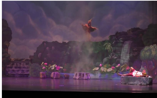
ภาพที่ 5 การแสดงละคร เรื่อง มโนห์รา ตอนพรานบุญจับนางมโนห์รา มูลนิธินาฏศิลป์สัมพันธ์

จากเนื้อเรื่องในบทละครข้างต้นจะกล่าวถึงตัวพรานบุญที่มีอาวุธคู่กาย คือ บ่วงนาคราช ที่มีจุดประสงค์ในการไปจับตัวนางกินรี ซึ่งเป็นเหตุการณ์สำคัญในเรื่อง อีกทั้งรูปแบบการแสดงในฉากนี้เป็นการรำเดี่ยวของตัวละครพรานบุญ หลังจากการรำตามบทร้องก็จะมีการเจรจาเป็นภาษาใต้ในการอธิบายขยายความต่อจากบทร้อง นอกจากนี้ยังมีการร้องประกอบการรำของตนเองอีกด้วย ซึ่งเป็นการแสดงถึงไหวพริบ ความสามารถ และฝีมือของนักแสดงที่ได้รับบทบาทการแสดงตัวพรานบุญ