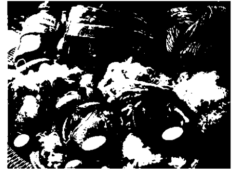
ผลิตภัณฑ์ต่างๆมีทั้งผงไหมและเส้นไหม