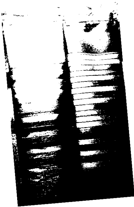
ผ้าไหมสีล้วนสวยสด