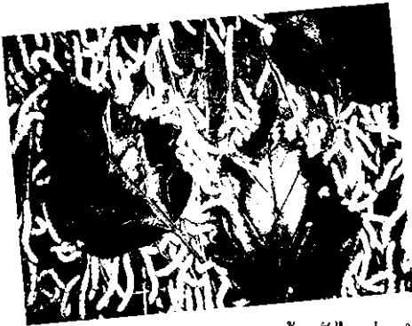
หน้าดาร์จไหมก่อนนำมาทอเป็นผ้าผืนงาม