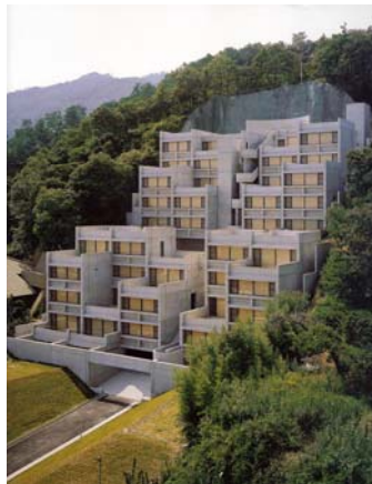
Rokko Housing โดย Tadao Ando แนว Phenomenology

การจัดทางเดินที่ให้ความหมายของเวลา ภาพของ Peter Wheelwright